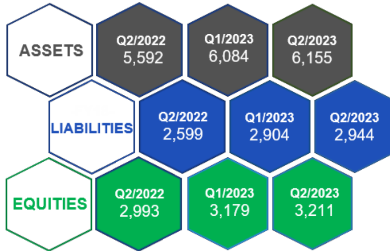
ภาพที่ 1: งบแสดงฐานะการเงินเปรียบเทียบ (แบบรายไตรมาส)

สาเหตุของการเปลี่ยนแปลงจากงบแสดงฐานะการเงินของกลุ่มบริษัท มีรายละเอียดดังต่อไปนี้