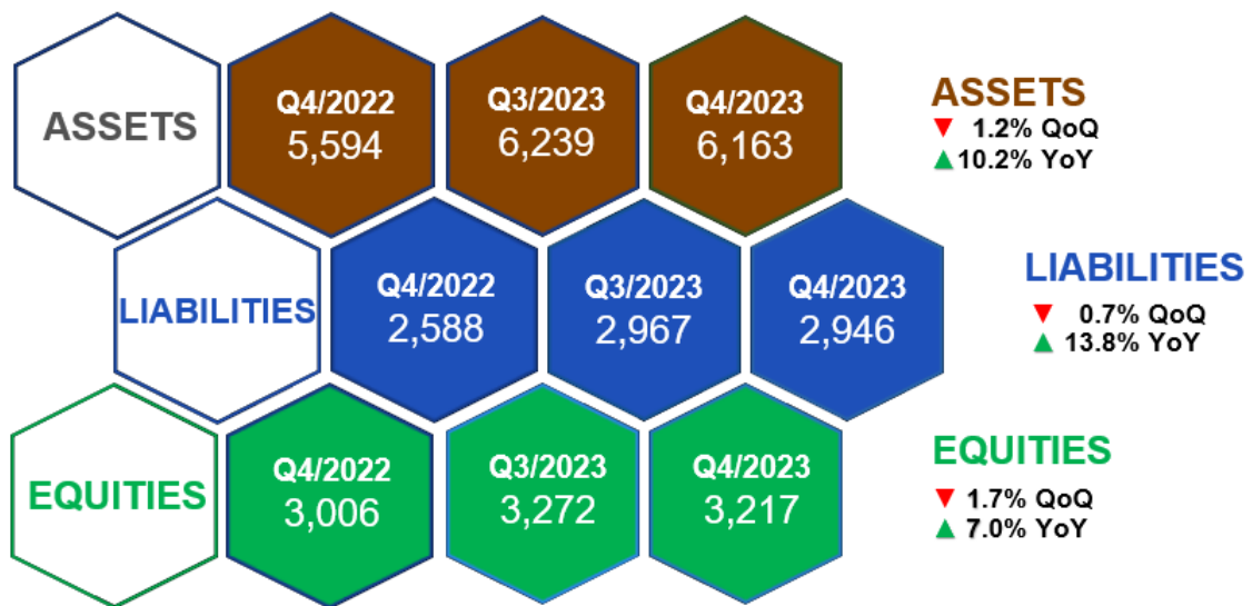
ภาพที่ 4: งบแสดงฐานะการเงินเปรียบเทียบ (แบบรายไตรมาส)

สาเหตุของการเปลี่ยนแปลงจากงบแสดงฐานะการเงินของกลุ่มบริษัท มีรายละเอียดดังต่อไปนี้